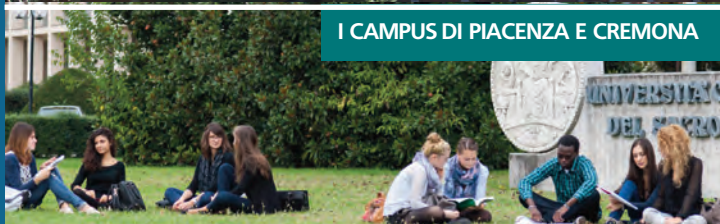
I CAMPUS DI PIACENZA E CREMONA