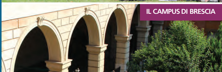
IL CAMPUS DI BRESCIA